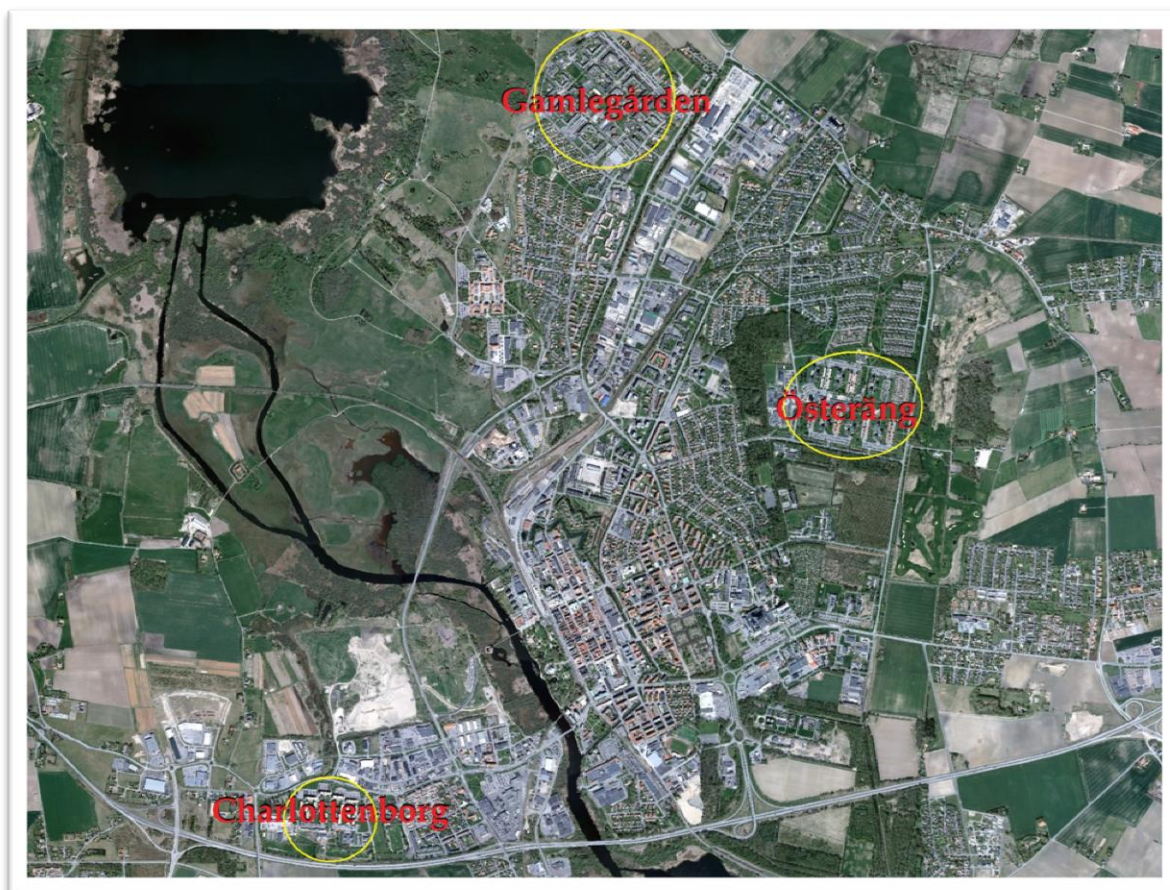
Karta 2: Kristianstads miljonprogramsområden