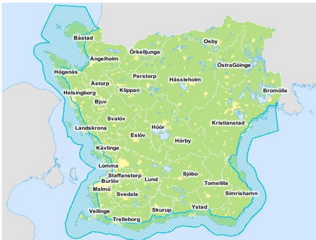
Bild 1: Kustzonen. Riksintresse enligt 4 kap 4 § miljöbalken efter riksdagsbeslut. 23

I det blåstreckade området gäller bestämmelserna kring fritidsbebyggelse som följer: