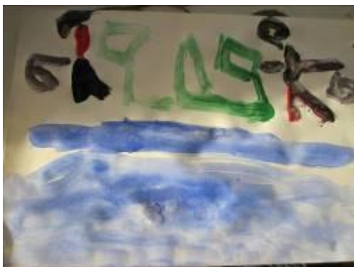
Adrian gläds över att hans bild blev så färgglad.