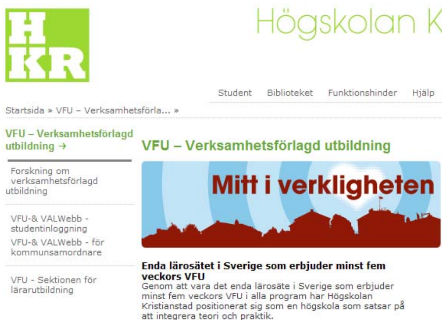
Figur 2 Länkning till sektioner och funktioner

Sektionen för Hälsa och Samhälle och LRC saknar egna ingångar från verksamhets förlagd utbildningshemsida. Därmed marknadsförs och informeras inte om LRC:s utvecklingsarbete och VFU-verkstad den vägen. När det gäller sektionen för Hälsa- och Samhälle får besökaren gå direkt till programmen, till exempel sjukvårdsutbildning och tandhygienistutbildning, för att kunna se att marknadsföring och genomförande också kompletteras av stödfunktioner i form av hjälp med placering. En möjlig förklaring är att den är programspecifik. Vid genomgången har ingen ingång till sektionsspecifik information om verksamhetsförlagd utbildning stått att finna. Sektionens webbplats länkar vidare till information om forskning, personal och kunskapsgrupper samt till programmen.