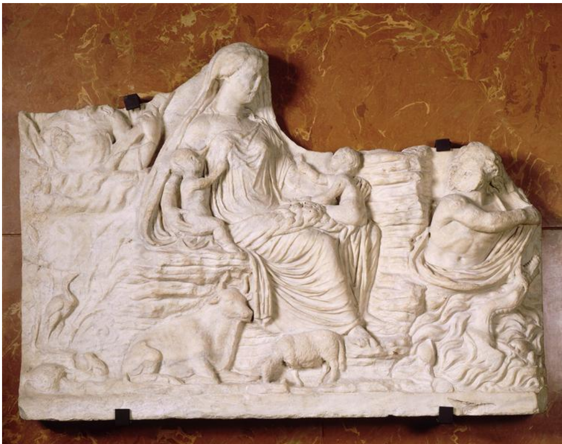
Fris från Karthago.