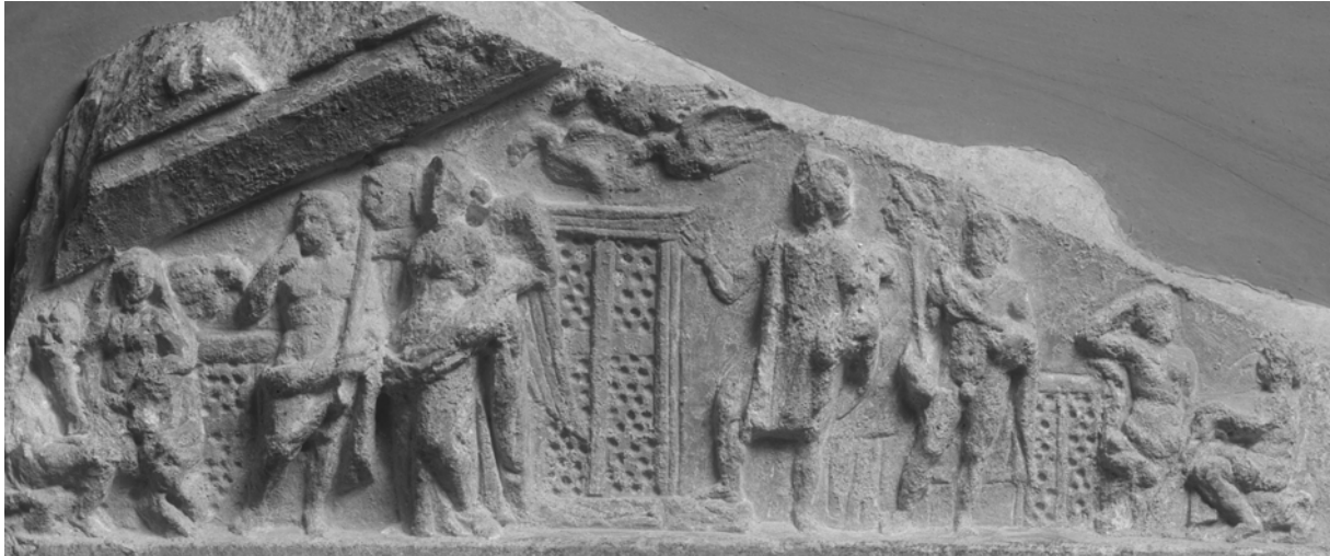
Del av fris från första århundradet e.Kr., vilken avbildar gavelfältet på Quirinus tempel, Fotot är, med tillstånd, beskuret av författaren.

Quirinus tempel, som låg på Quirinalen, restaurerades och byggdes ut av kejsar Augustus år 16 f.Kr. 114 På templets gavelfält, se bild ovan, avbildades, från vänster till höger, Romulus, den med ymnighetshorn försedda Pales, Jupiter, Mars, Victoria, Mercurius, en oidentifierbar gudinna, Herkules, ytterligare en oidentifierbar gudinna samt Remus. Romulus och Remus framställs som augurer. I centrum, ovanför dörren i gallerverk, syns några av de tolv gamar, vilka visade sig när Romulus genom augurernas auspicium gavs företräde framför Remus. 115 Pales framställs alltså här som närvarande vid ett för Romulus och staden Rom avgörande ögonblick.