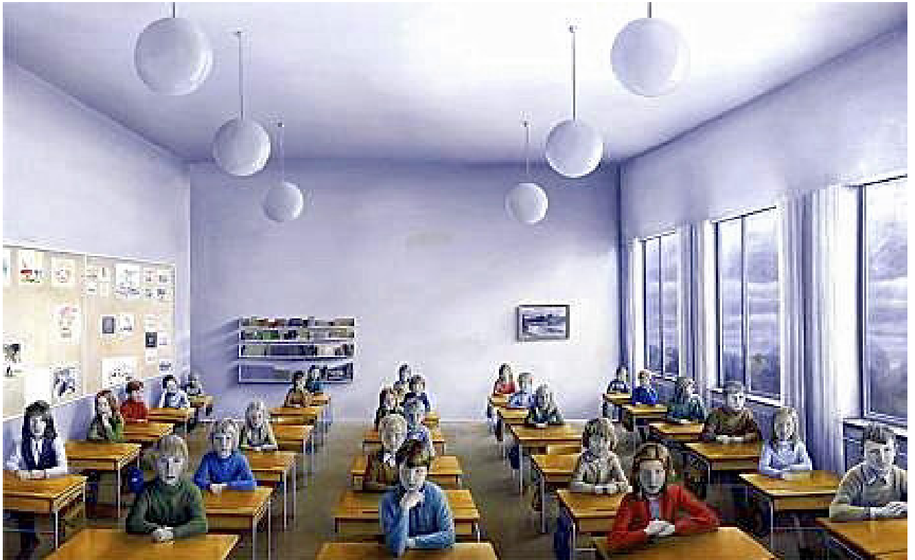
Konstnär; Peter Tillberg