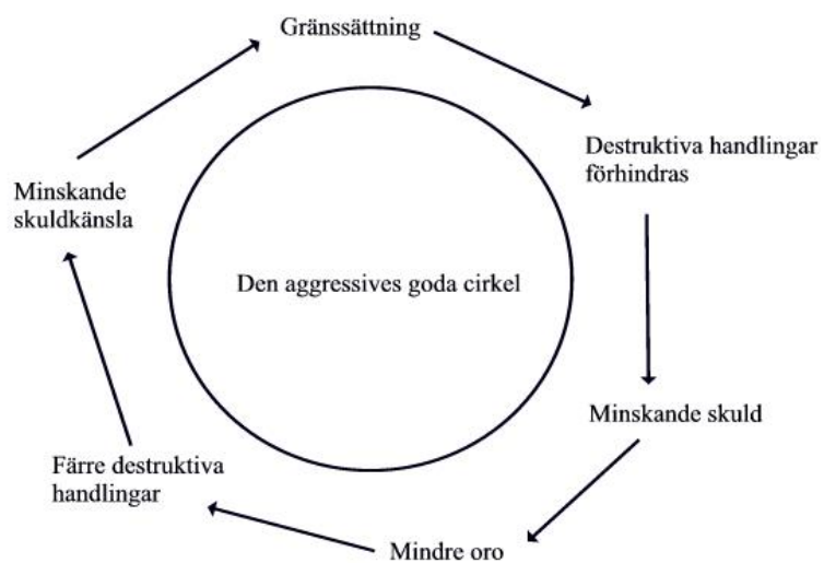
Figur 2 (Nilsson & Nilsson 1997:16)

För att vända de negativa cirkelarna till positiva kan man göra på följande sätt: