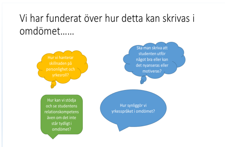
Figur 2. Formuleringar i VFU-omdömet

Nästa bild som presenterades handlade om att kunna formulera sig tydligt i VFU-omdömet.