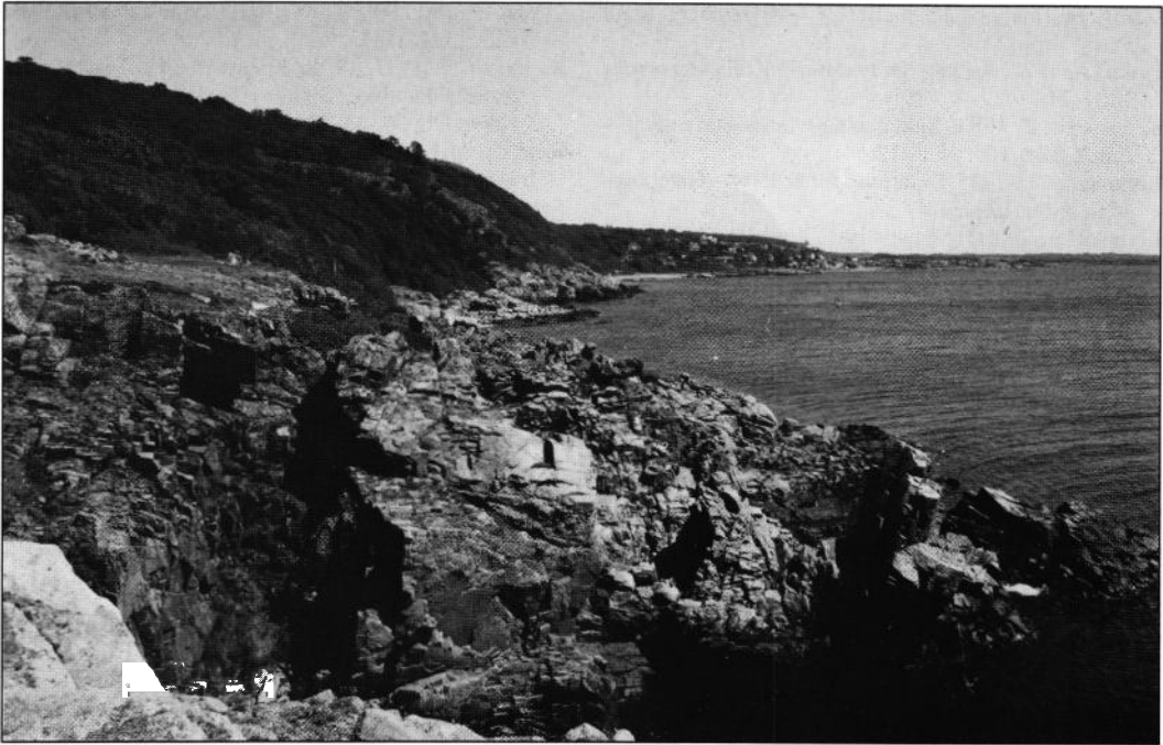
Fig. 3. Den sydvästra branten av Kullaberg i Skåne. I bakgrunden ekkraften där taggspindeln Cheiracanthium elegans hittades. På berget lever många intressanta värmekrävande spindelarter, som tapetserarspindeln Atypus affinis , sexögonspindlarna Harpactea hombergi och Segestria bavarica , plattbuksspindeln Trachyzelotes pedestris , säckspindlarna Agroeca cuprea , Phrurolithus minimus och Clubiona genevensis , vargspindeln Pardosa alacris , klotspindeln Theridion conigerum , krabbspindeln Ozyptila nigrata och krusnätspindeln Dictyna latens .

The southwest slope of Kullaberg, province of Skåne. Many rare thermophilous species of spiders live in this area, for example Cheiracanthium elegans , Atypus affinis , Harpactea hombergi , Segestria bavarica , Trachyzelotes pedestris , Agroeca cuprea , Phrurolithus minimus , Clubiona genevensis ,